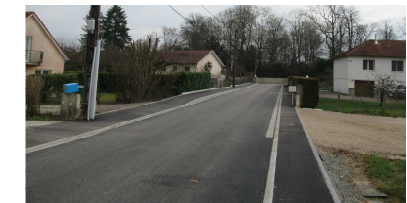
Rue derrière la ville

Les travaux de voirie prévus en 2020 sont maintenant terminés. La rue du château avait été retenue dans le cadre du programme GER (gros entretien renouvellement) du Grand Besançon qui consiste en une remise en état sans amélioration (bicouche). Au vu de l'état de cette voie et de son trafic important il a été décidé d'opter pour un enrobé avec un surcoût à charge de la commune d'environ 6 000€.